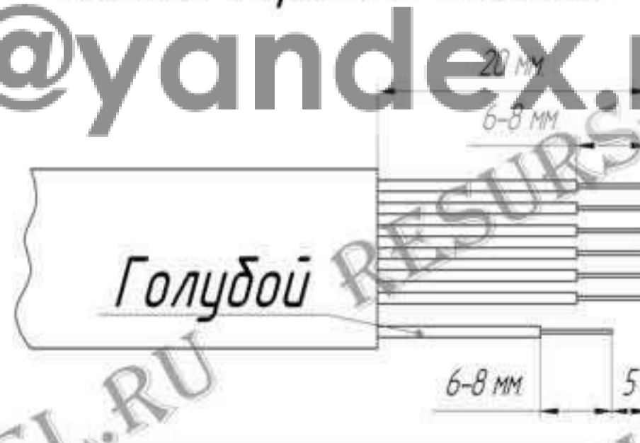
Схема обрезки кабеля