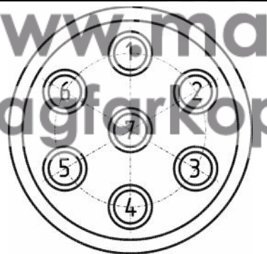
Схема обрезки кабеля