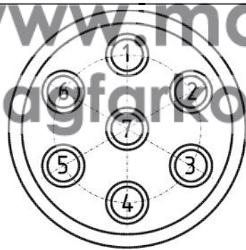
Схема обрезки кабеля