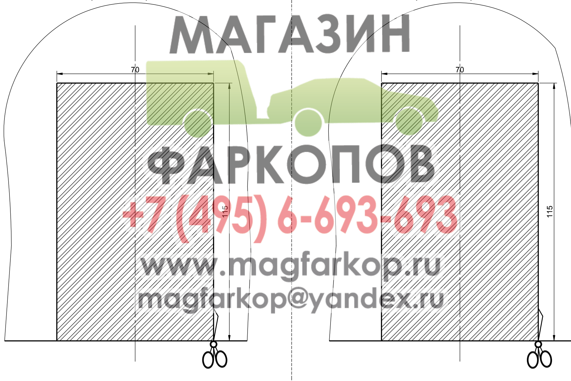
Вырез бампера OPEL МОККА 2012 -...г.в. (O116-A) 1:1